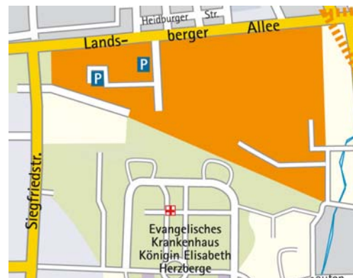
Mikrostandort: Gewerbegebiet Landsberger Allee