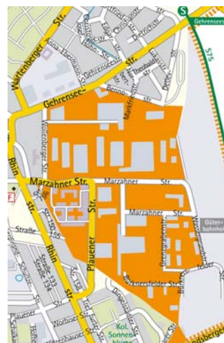
Mikrostandort: Gewerbegebiet Marzahner Straße/ Plauener Straße

Gewerbegebiet Marzahner Straße/Plauener Straße