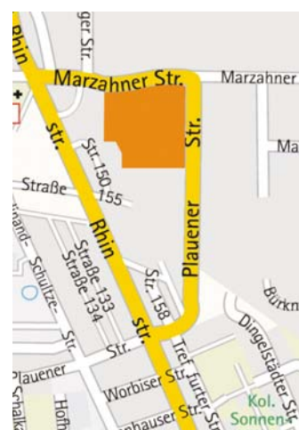
Mikrostandort: Gewerbehof Plauener Straße