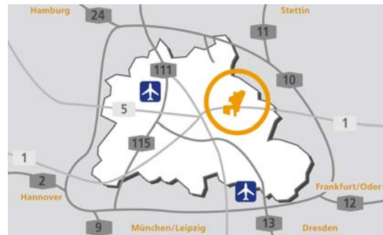
Lage des Gewerbeareals Berlin eastside in Berlin