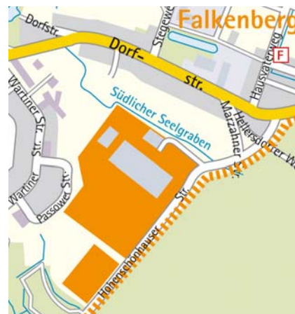
Mikrostandort: Gewerbegebiet Hohenschönhauser Straße