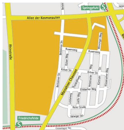
Mikrostandort: DOBA-Industrie- und Gewerbepark Rheinstraße 48 / Allee der Kosmonauten

DOBA-Industrie- und Gewerbepark Rheinstraße 48