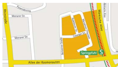
Mikrostandort: DOBA-Gewerbepark Berlin Springpfuhl / Beilsteiner Straße