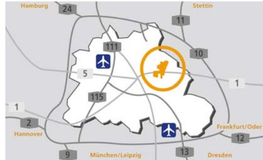
Lage des Gewerbeareals Berlin eastside in Berlin