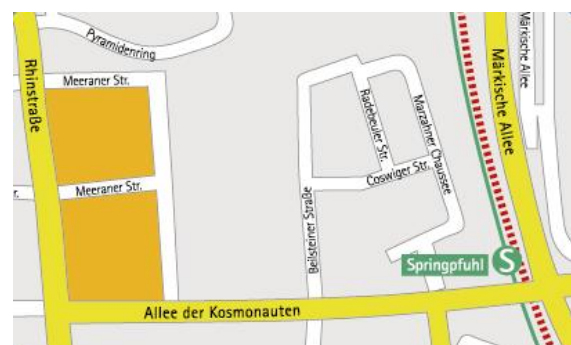
Mikrostandort: DOBA-Industrie- und Gewerbepark Rhinstraße 100-132