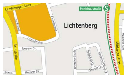
Mikrostandort: Die Pyramide / Pyramidenring