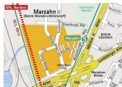
Mikrostandort: Gewerbepark Georg Knorr