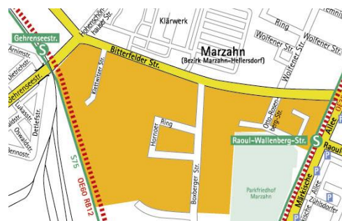
Mikrostandort: Gewerbe- und Technologiepark Berlin Marzahn