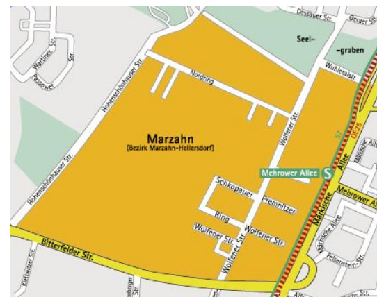
Mikrostandort: Gewerbegebiet und GSG-HOF Wolfener Straße