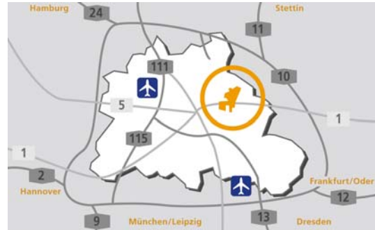
Lage des Gewerbeareals Berlin eastside in Berlin