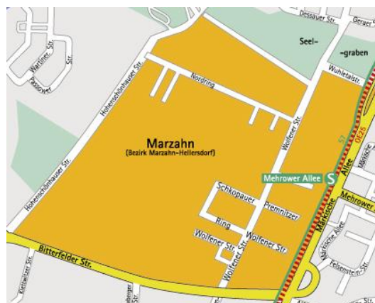
Mikrostandort: Gewerbegebiet Wolfener Straße